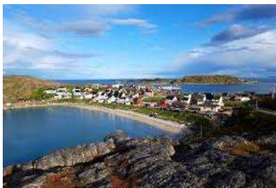
Pykeija –suomalaiskylä Norjassa

Aamiaisen jälkeen matkamme jatkuu Norjan puolelle. Ajamme Sevettijärven, Kolttakönkään ja Neidenin kautta Jäämeren rannalle, pieneen ja kauniiseen suomalaiskylään Pykeijaan. Lounastamme ja ihailemme maisemia ja lähdemme Nuorgamiin ja edelleen Utsjoen kylään ja Kirkkotuville. Palaamme takaisin Inariin Kaamasen kautta. Päivällinen ja yöpyminen hotellissa.