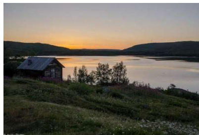
Nuorgam- Suomen pohjoisin kylä